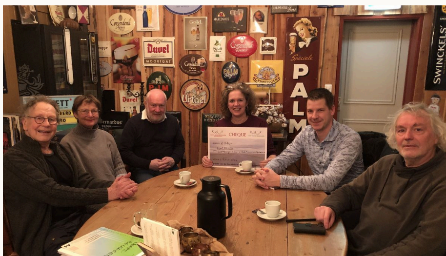
Foto's 1 en 2 (boven wie gingen jou voor): Stratenmakers Festival in Tweede Exloërmond

Ben je benieuwd naar welke initiatieven jou voorgingen? Lees dan meer over het Stratenmaker Festival in Tweede Exloërmond en het project Klik en tik van dorpsbelangen Spijkerboor en Oud- en Nieuw Annerveen . Zij kregen onlangs nog een bedrag gehonoreerd vanuit het kiem- en zaaigeld.